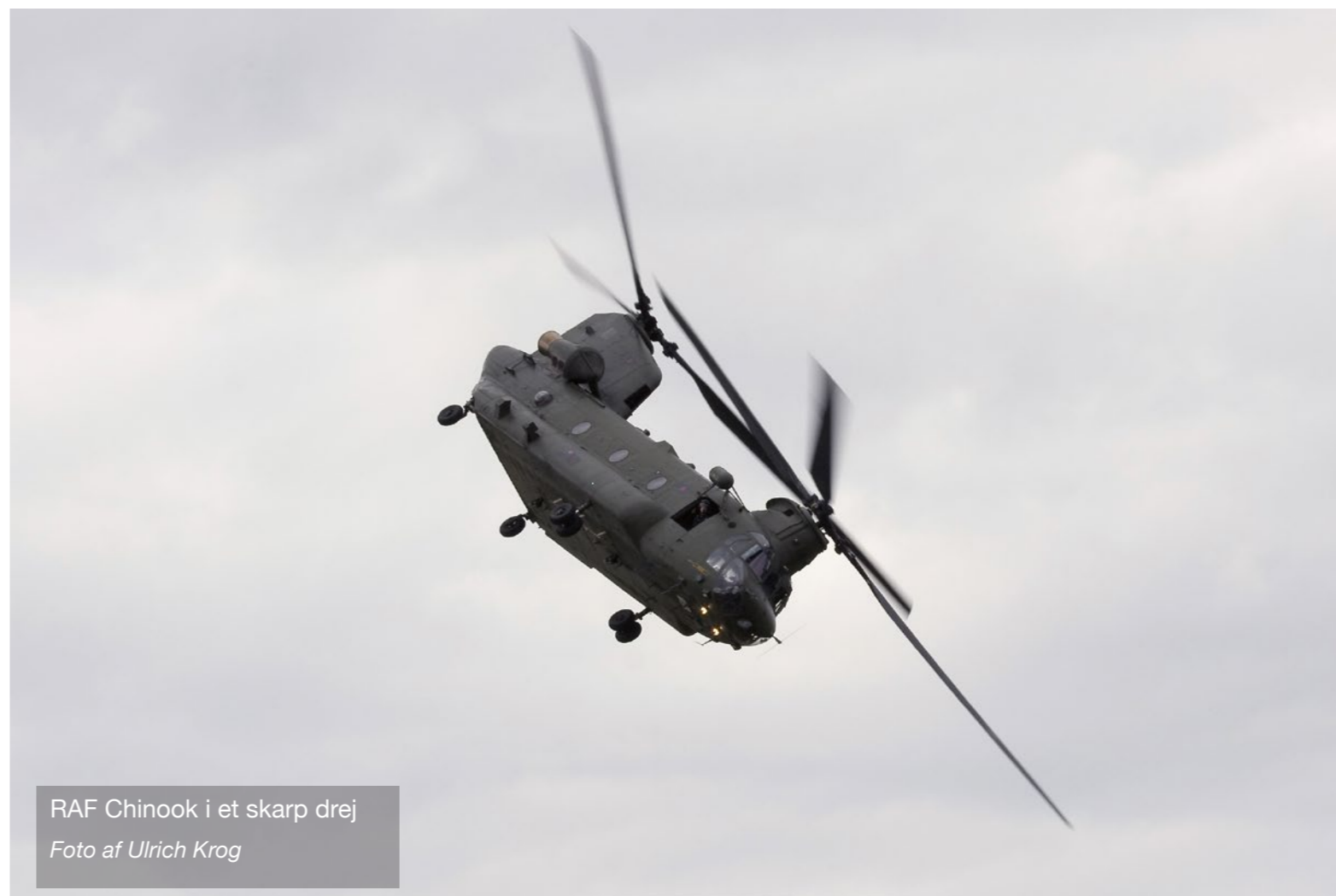
RAF Chinook i et skarp drej