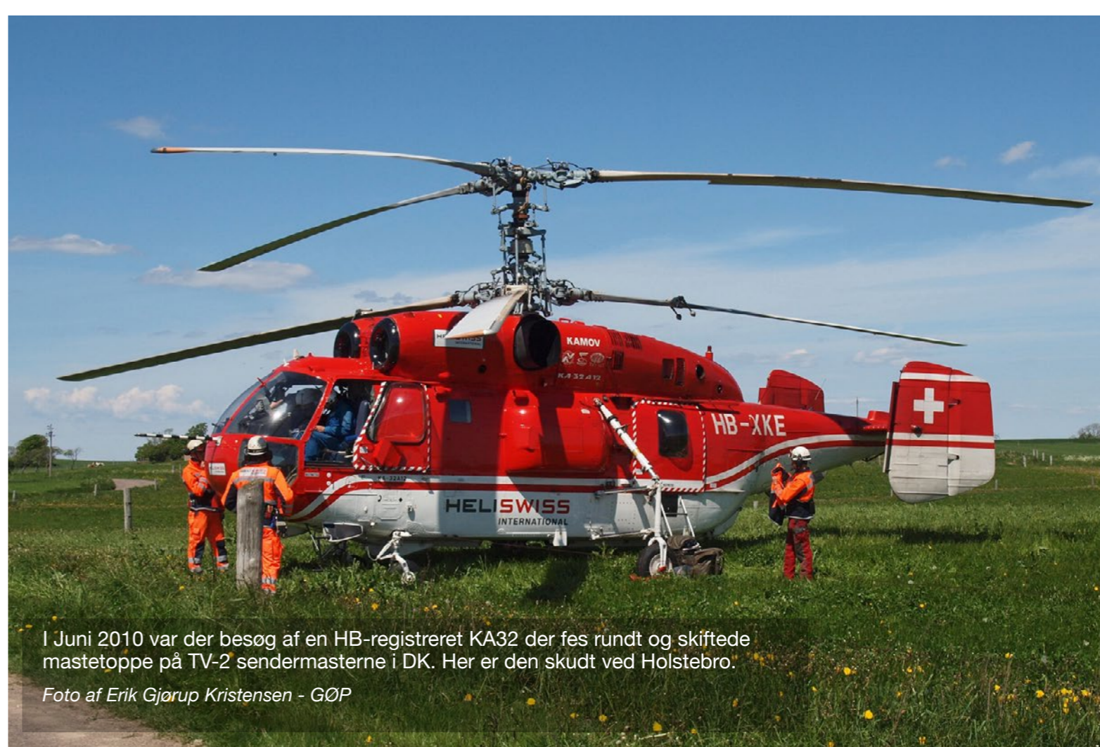
I Juni 2010 var der besøg af en HB-registreret KA32 der fæs rundt og skiftede mastetoppe på TV-2 sendermasterne i DK. Her er den skudt ved Holstebro.