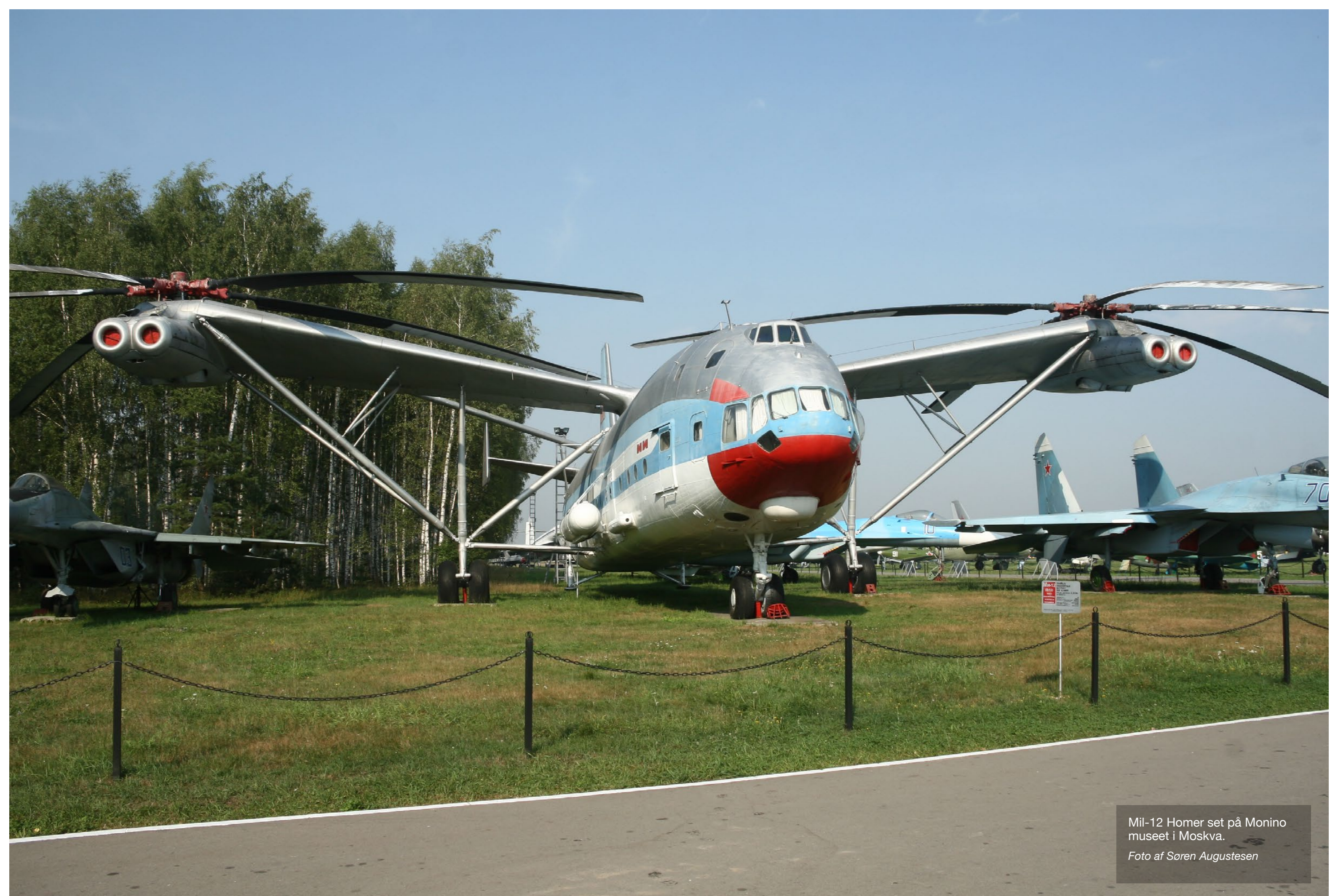
Mil-12 Homer set på Monino museet i Moskva.