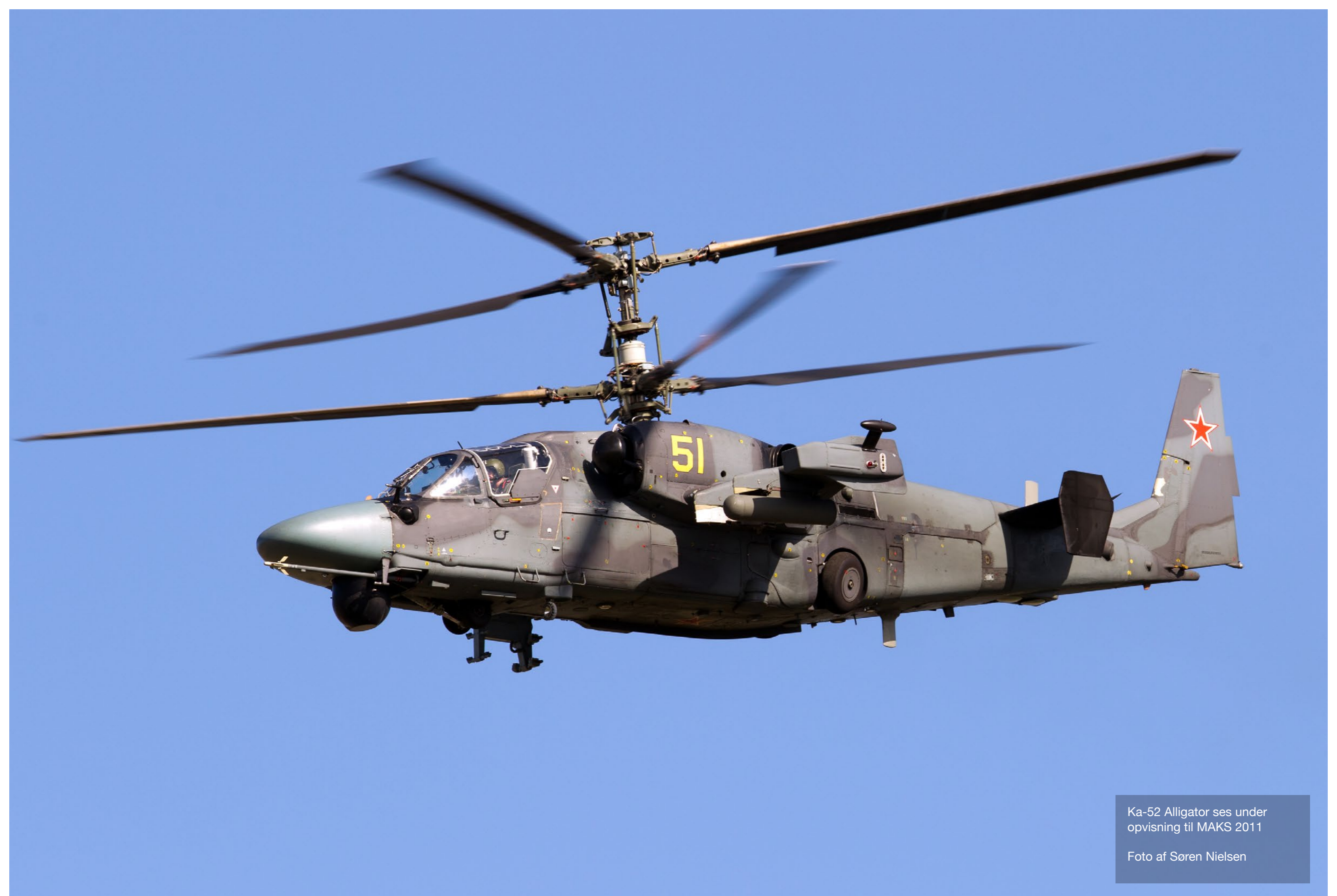
Ka-52 Alligator ses under opvisning til MAKS 2011