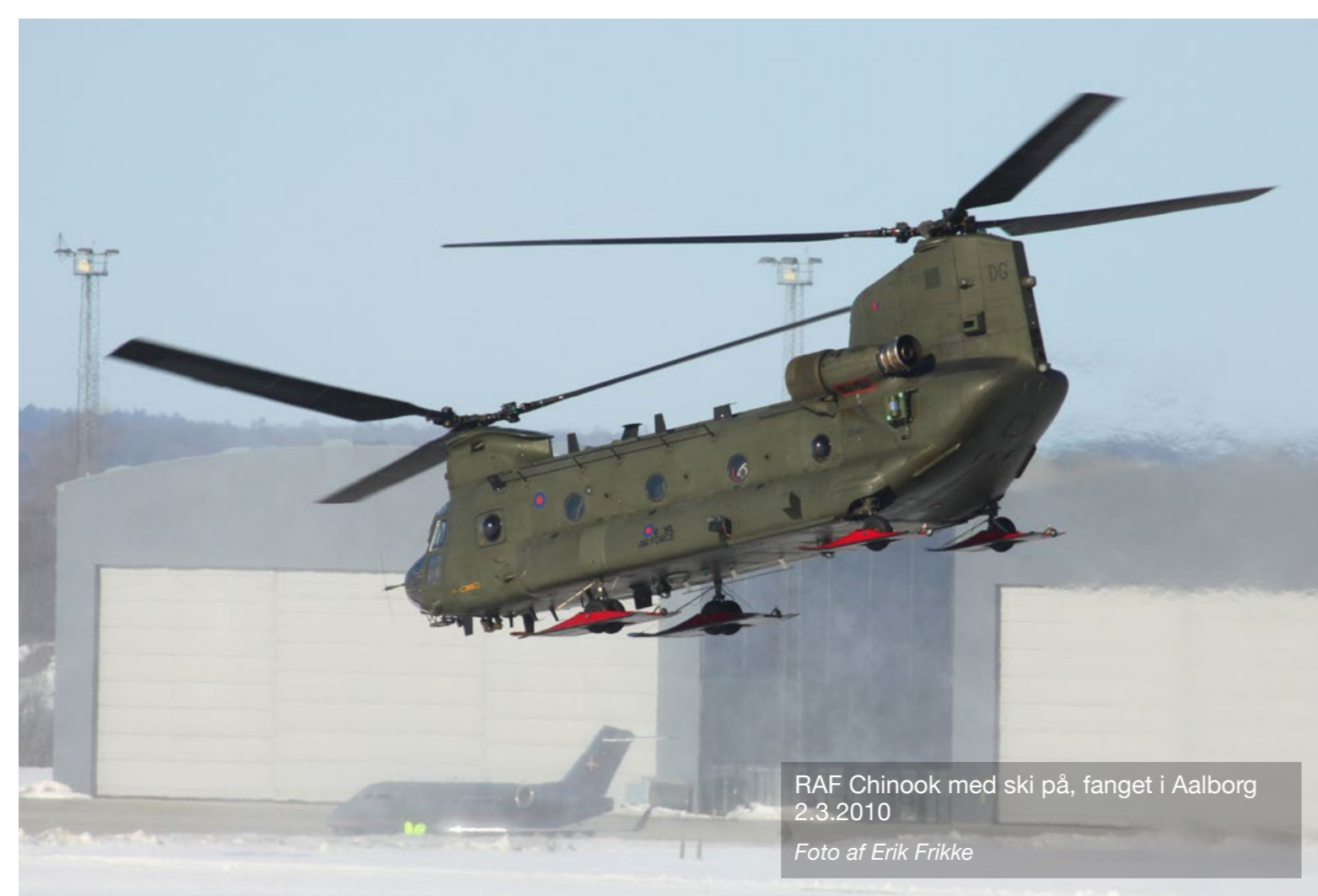
RAF Chinook med ski på, fanget i Aalborg 2.3.2010