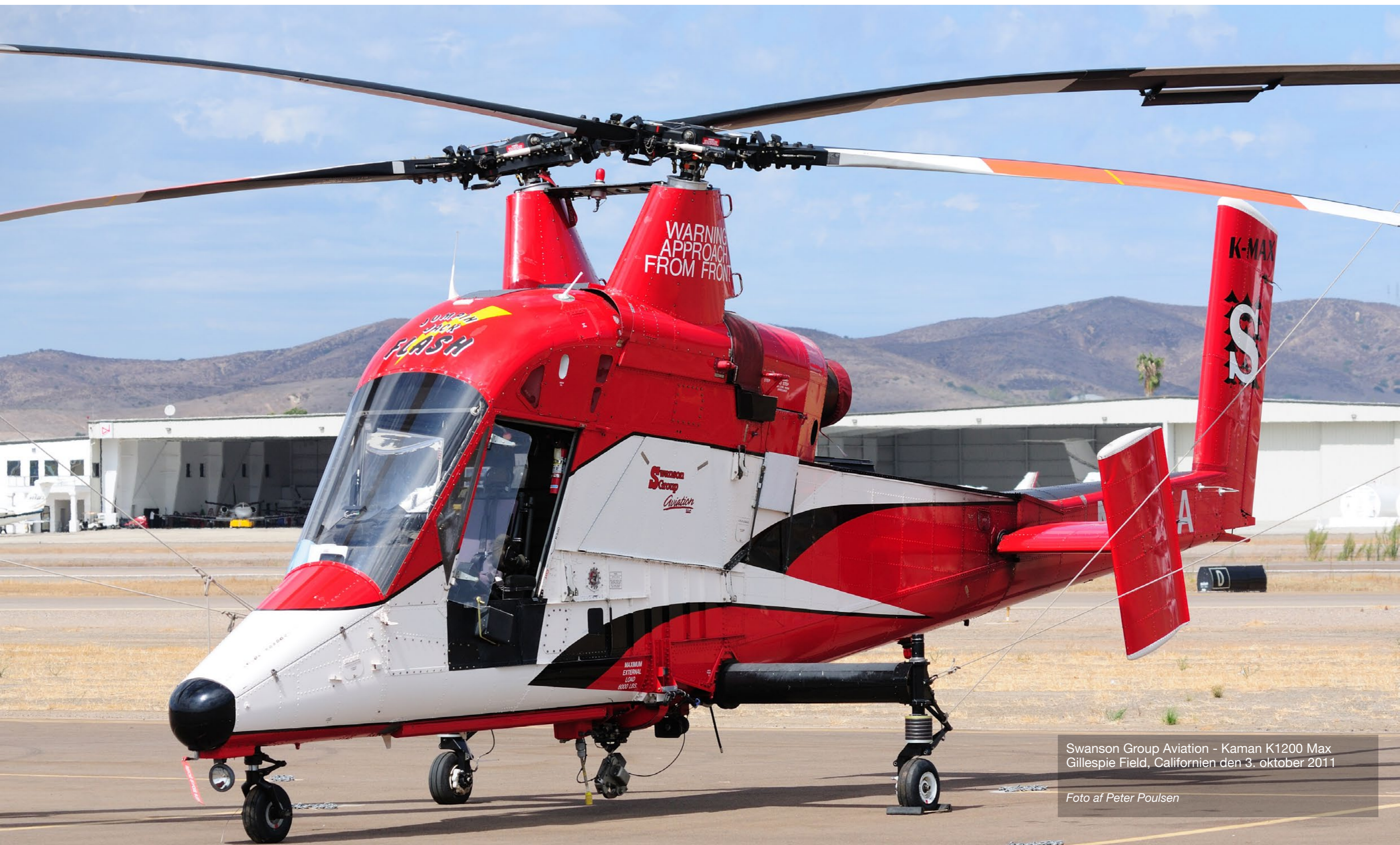
Swanson Group Aviation - Kaman K1200 Max Gillespie Field, Californien den 3. oktober 2011

UDVALGTE TEMA FOTOS INSENDT AF VORES LÆSERE