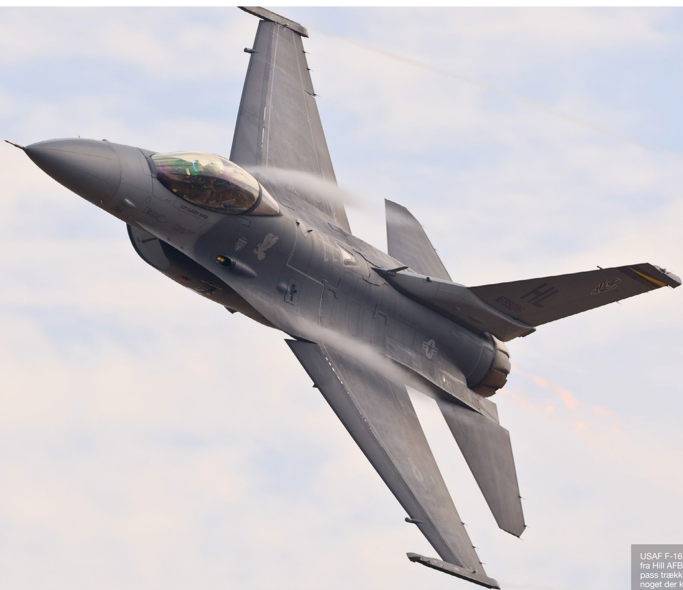
USAF F-16 Viper Demo Team West, fra Hill AFB i Utah. I dette dedication pass trækkes der tæt ved 9 g, det er noget der kan mærkes for piloten!