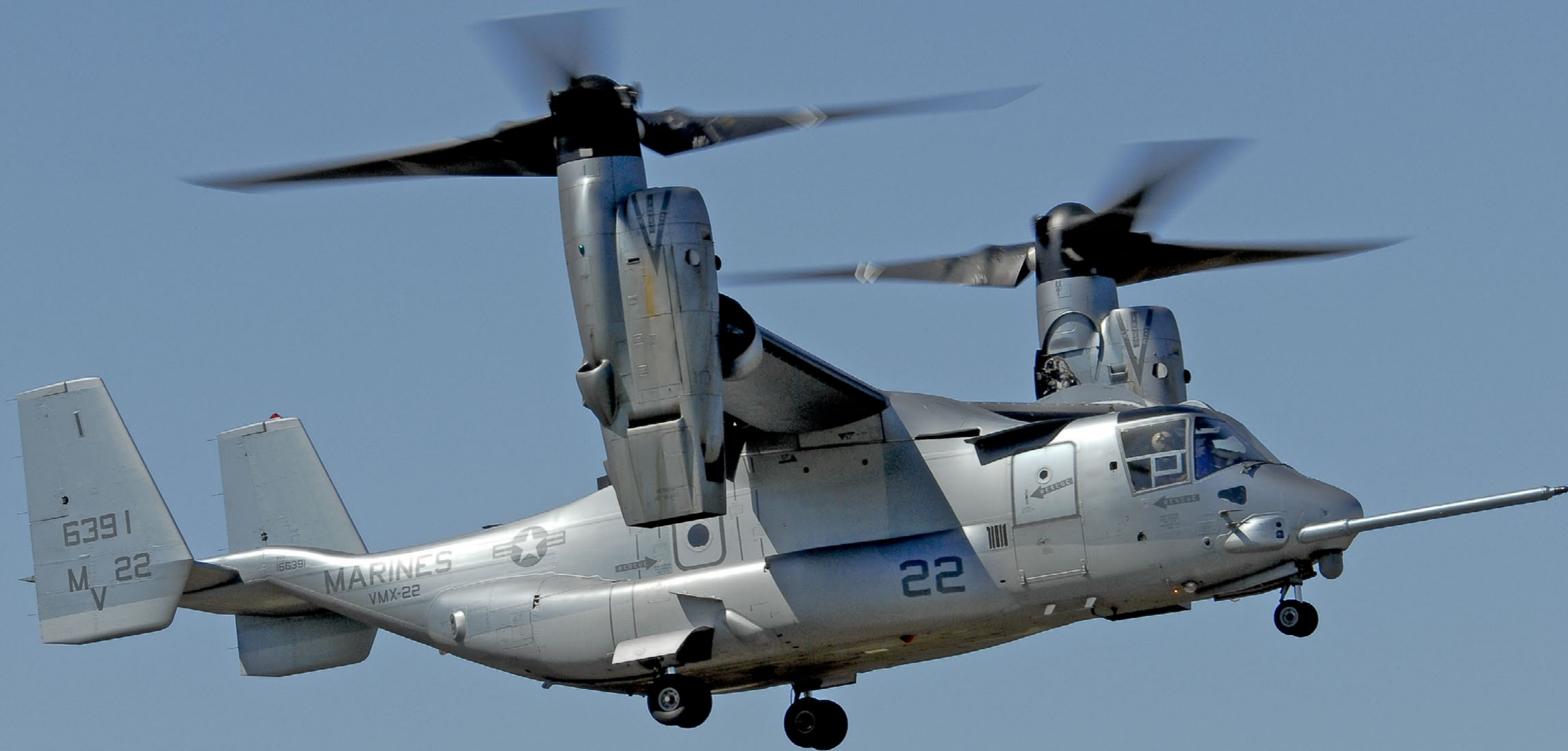
Bell Boeing MV-22B Osprey. Billedet er taget til RIAT, RAF Fairford den 16. juli 2006.