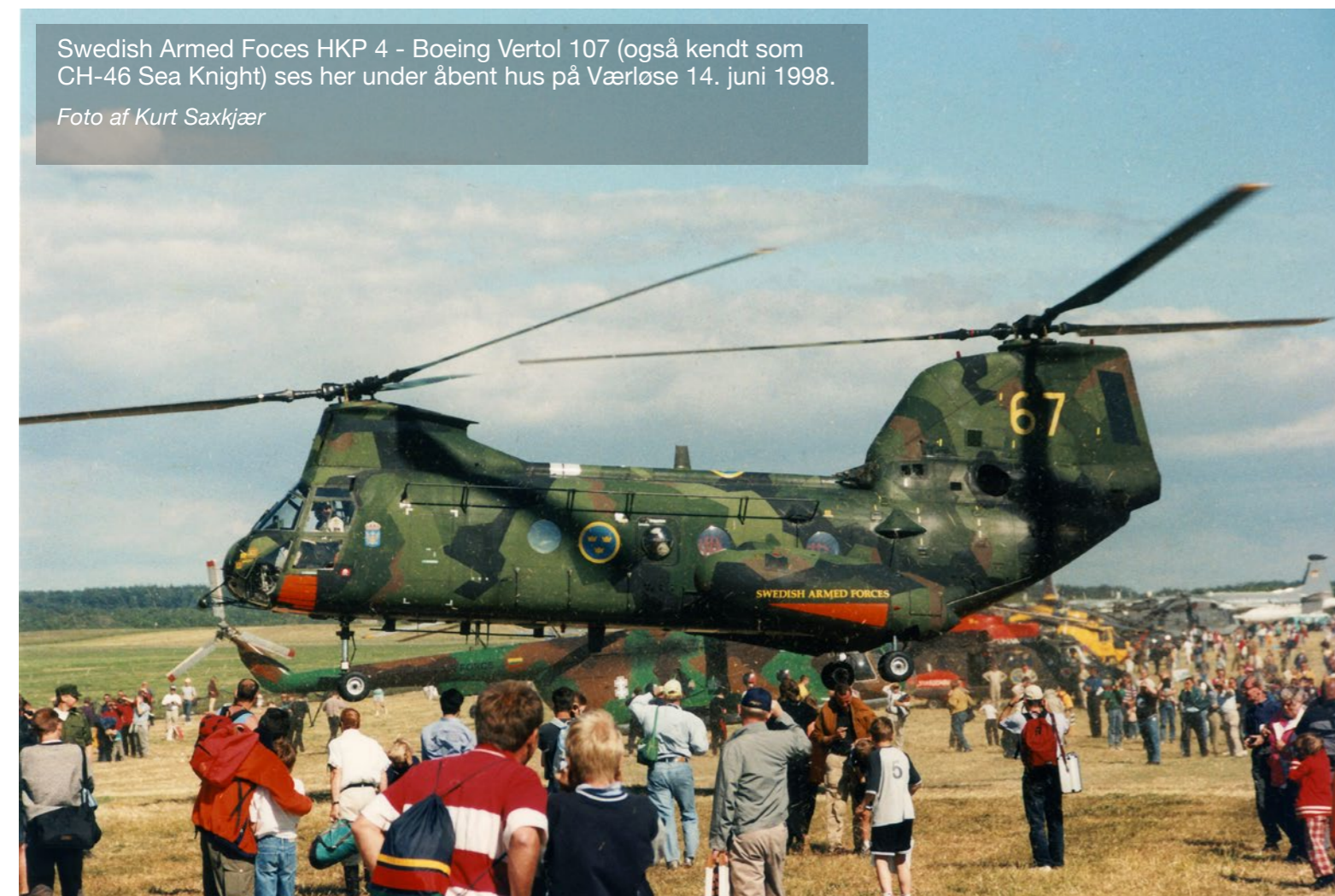
Swedish Armed Forces HKP 4 - Boeing Vertol 107 (også kendt som CH-46 Sea Knight) ses her under åbent hus på Værløse 14. juni 1998.