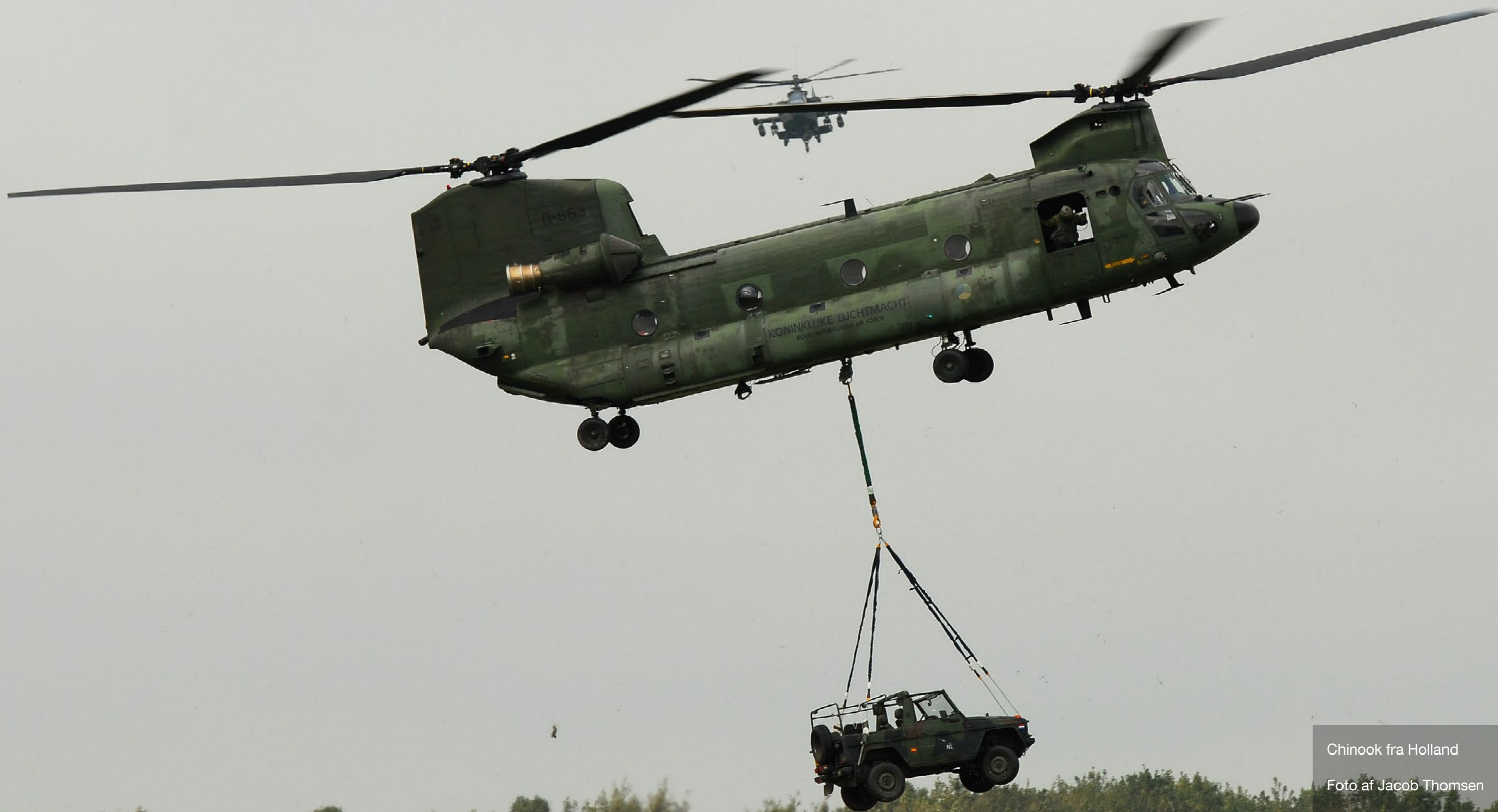
Chinook fra Holland