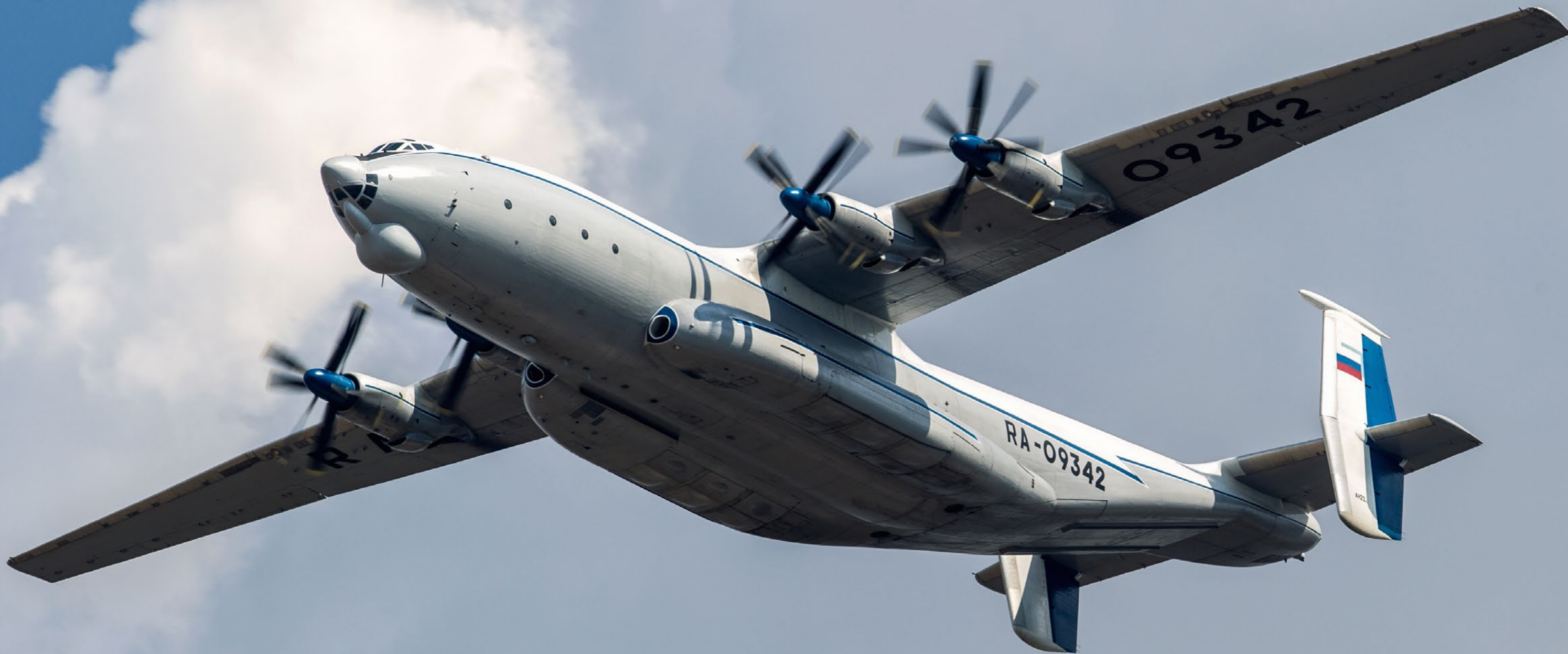
Giganten fra Tver; den mægtige An-22, med sine 4 counter rotating propeller.