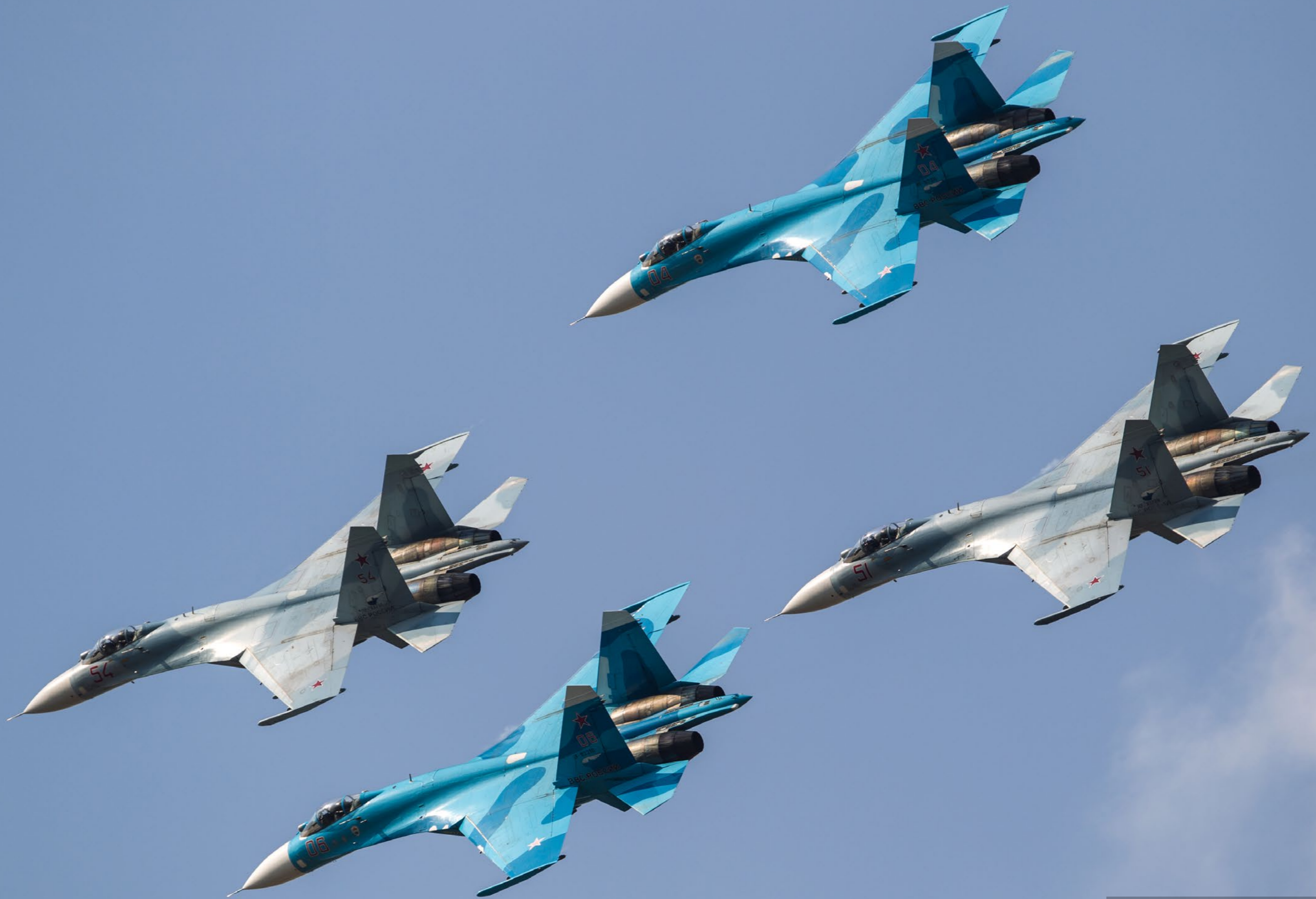
De 4 Su-27SM fra Lipetsk viser deres spændende og flotte bemaling.