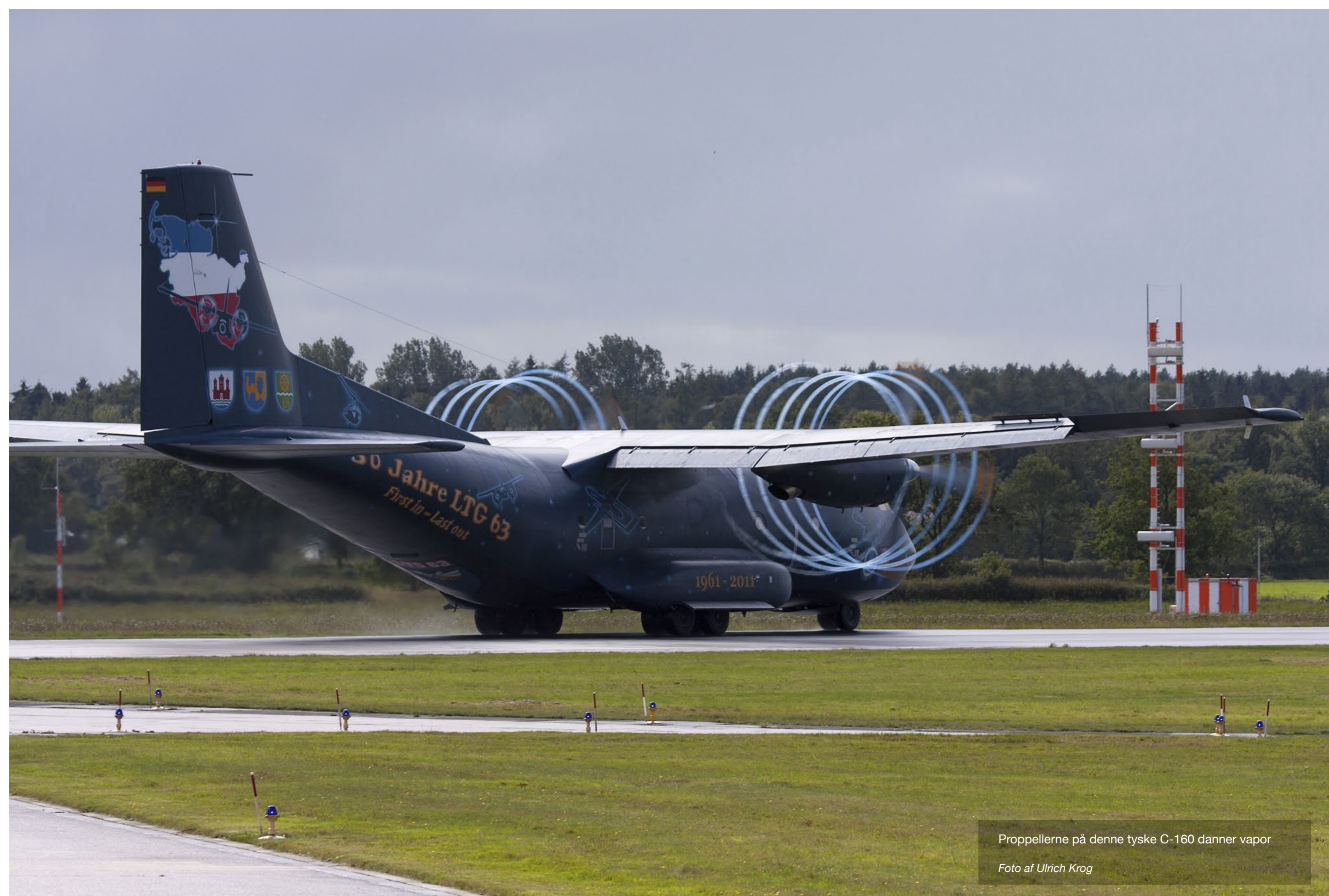
Proppellerne på denne tyske C-160 danner vapor