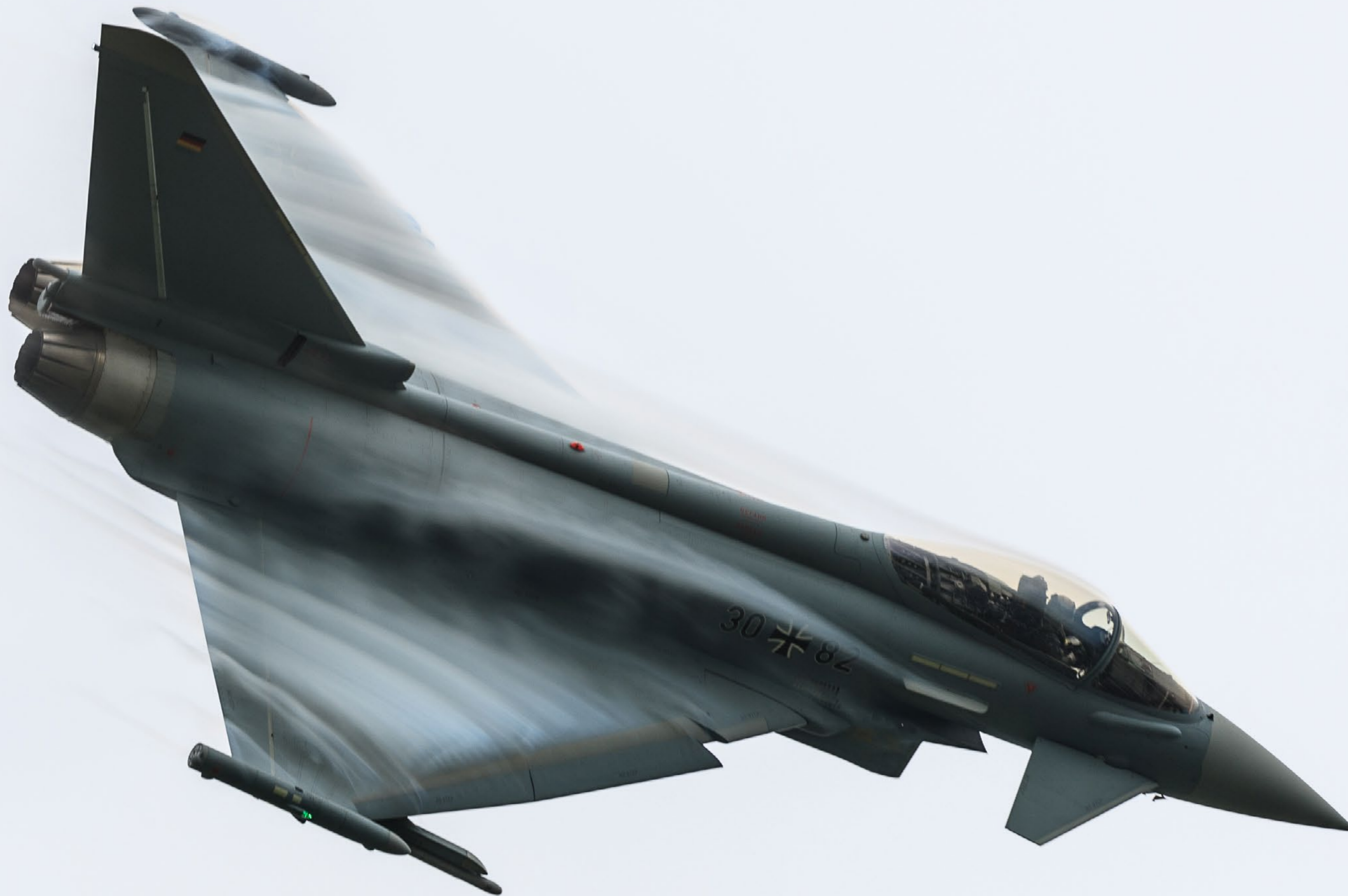
Tysk Typhoon med vapor fra airshowet på Aalborg