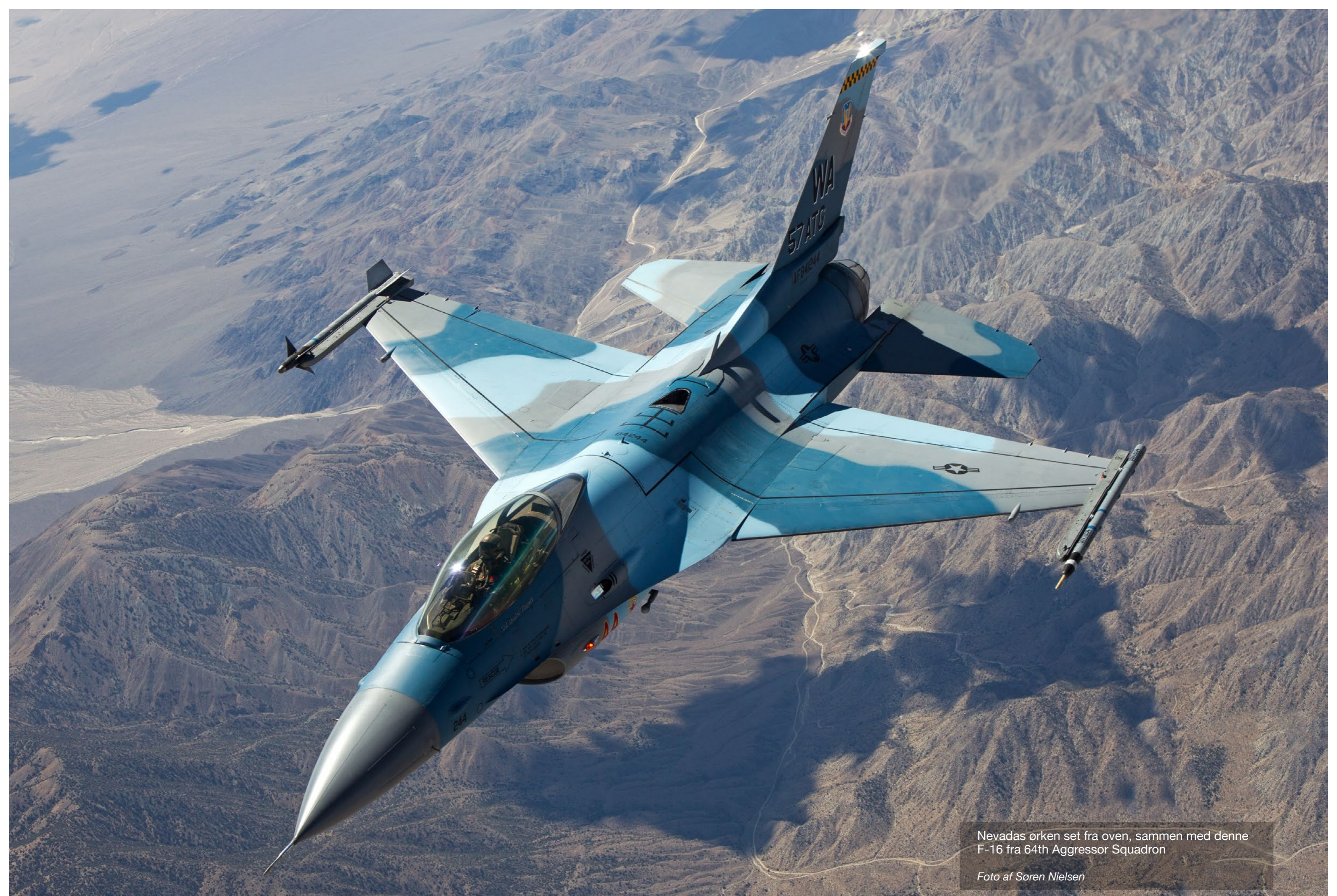
Nevadas ørken set fra oven, sammen med denne F-16 fra 64th Aggressor Squadron